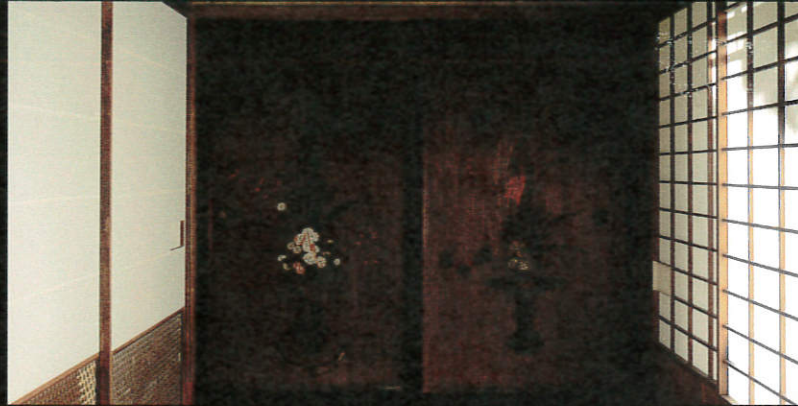
二代目専好の立花が杉戸絵に残る山荘

寛永の京都・西賀茂、一条恵観により営まれていた山荘茶屋。現在は鎌倉に移築され、国指定重要文化財「一条恵観山荘」として座しています。この山荘に華人・茶人をはじめとした文化人が集い、文化・芸能を通じて交流を深めていた往時の姿に思いを馳せ、華道家元池坊次期家元 四代目池坊専好氏が二代目専好の立花を再現し、遠州茶道宗家十三世家元小堀宗実氏が釜を掛けてお迎えいたします。